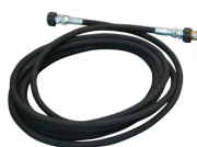
Prolunga mt. 8