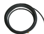
Stura tubi mt. 8

Richiedi un preventivo dettagliato inviando una mail a info@cinomaticnew.com