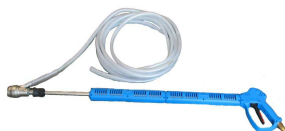
N° 1 Pistola+Lancia Sabbiante