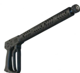
N° 1 Pistola